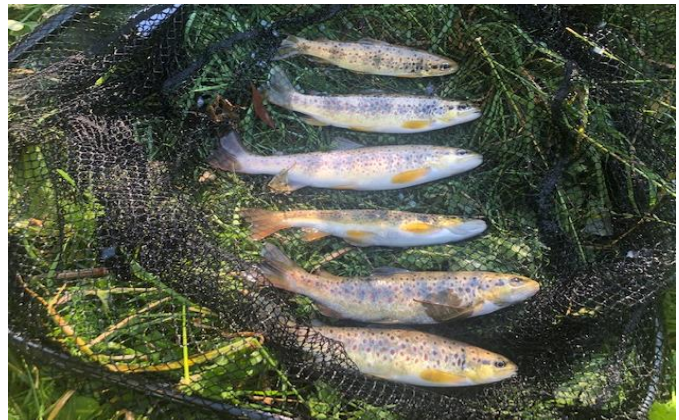
Слика 2: Дел од забележаниот улов на македонска пастрмка.