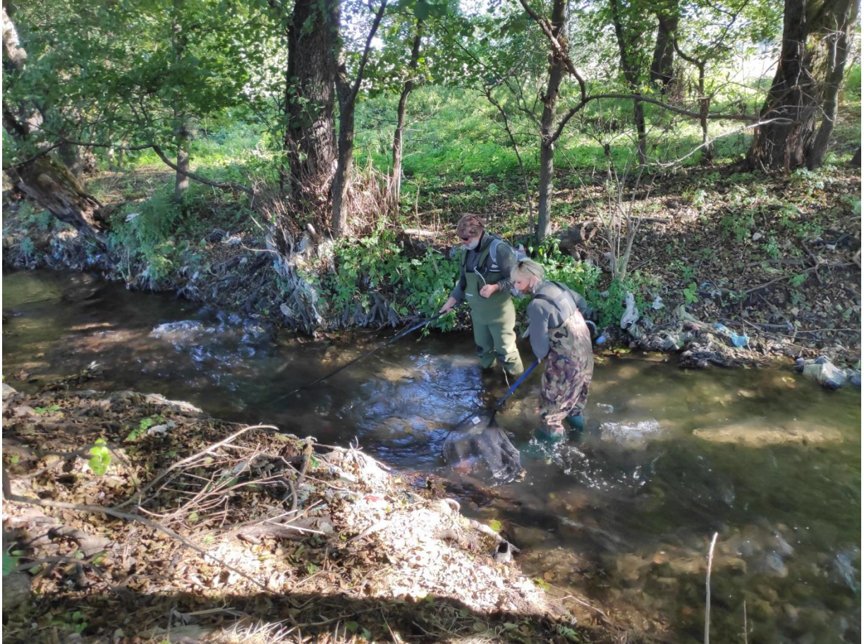
Слика 1: Местото каде мостот бр. 1 ја преминува Зајаска река.