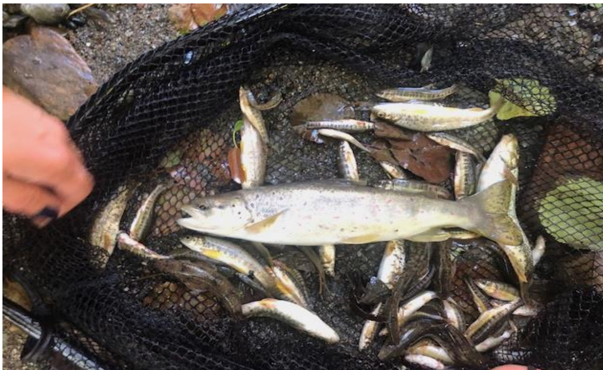
Слика 5: Дел од забележаниот улов риба.