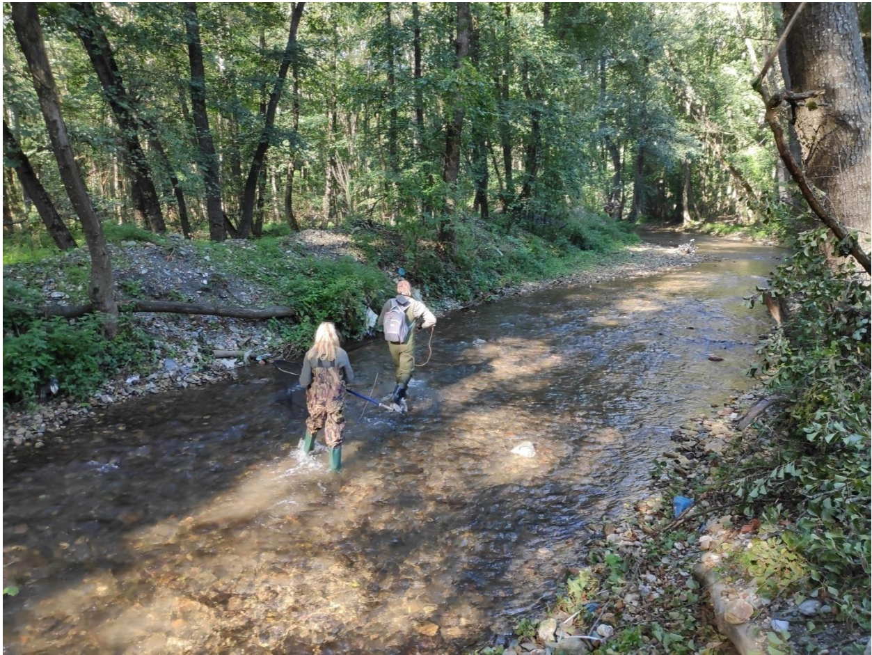
Слика 4: Местото каде мостот бр. 3 ја преминува Зајаска река.