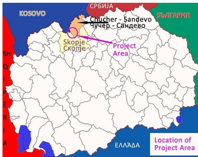
Слика 1 Мапа на локација на општина Чучер-Сандево

Проектната област се наоѓа во една општина: Чучер - Сандево.