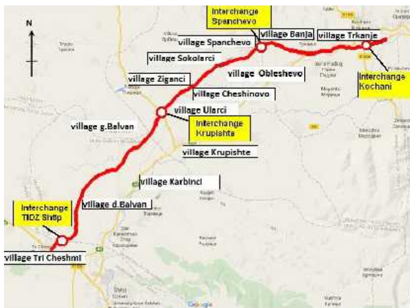
Слика 3 – Шематска карта на локалните заедници и клучките во проектираната област

Експресниот пат се наоѓа на Источниот плански регион од Република Македонија. Ќе минува низ 4 општини: Штип, Карбинци, Чешиново-Облешево и Кочани (со население од околу 88.000 жители согласно Пописот од 2002 год.). На север од планираниот експресен пат се наоѓаат следните селски населби: Чардаклија, Горни Балван, Жиганци, Соколарци, Спанчево, Бања и Тркање, а на југ Долни Балван, Батање, Крупиште, Карбинци, Уларци, Чешиново, Облешево (Слика 3). Вкупното население во Источниот плански регион е 177.988.