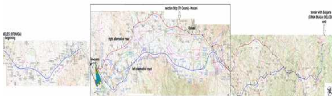
Слика 1 - Двете алтернативи разгледувани во Физибилити студијата (Сина линија – „лева алтернатива“, црвена линија – „десна алтернатива“)

За првата опција беше изготвена Физибилити студија со Анализа на проектираниот сообраќај за автопатно решение за Националниот пат М-5: Бугарска граница (Црна Скала) – Три Чешми – Кадрифаково – Отовица и беше изготвена во декември 2011 год. Студијата ја испитува тековната фреквенција на сообраќај, планираниот сообраќаен тек и потенцијалните социјални и економски подобрувања што се појавуваат од подобрата комуникација. Физибилити студијата разгледува две алтернативи решенија „десна алтернатива“ и „лева алтернатива“ во однос на текот на реката Брегалница (Слика бр. 1).