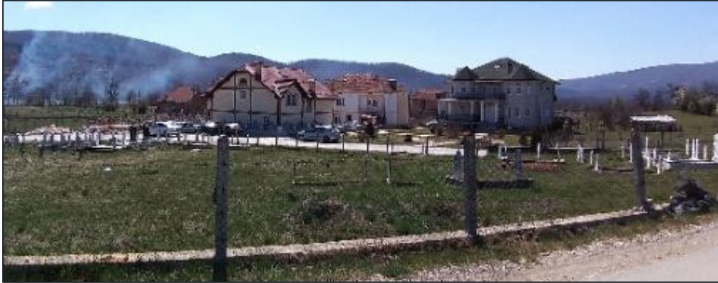
Figura 9-5 - Varrezat në qytetin e Kërçovës