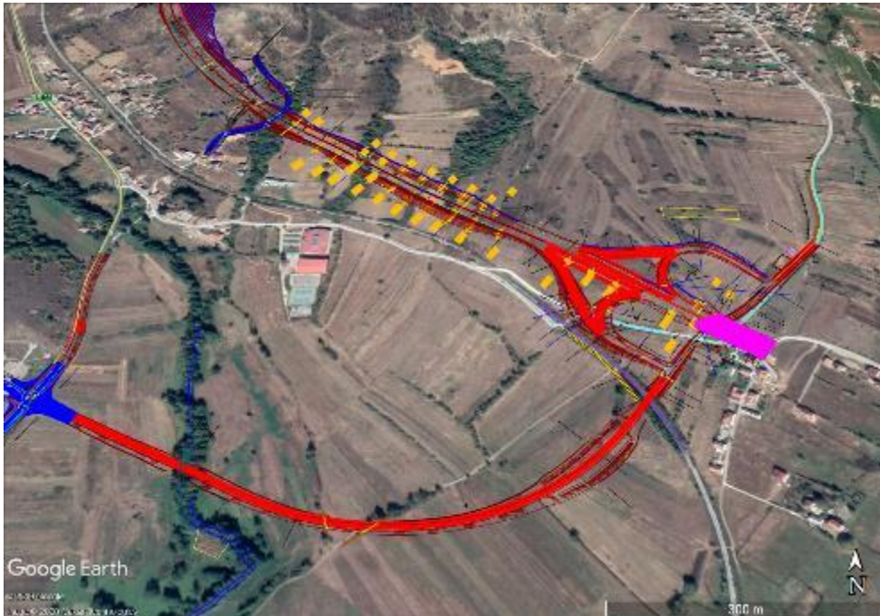
Figura 9-3 – Nyje të reja dhe mbikalim

9.10.9. Këto efekte operative sociale dhe shoqërore nuk është paraparë të jenë shqetësuese, pas zbatimit të masave zbutëse në PMAMS.