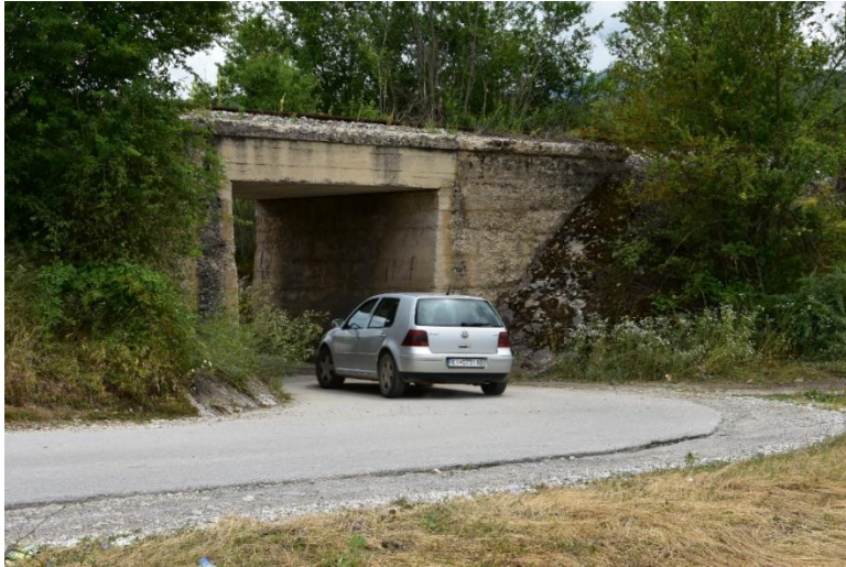
Figura 9-2–Kalimi joformal i hekurudhor (në veri të nënkalimit)