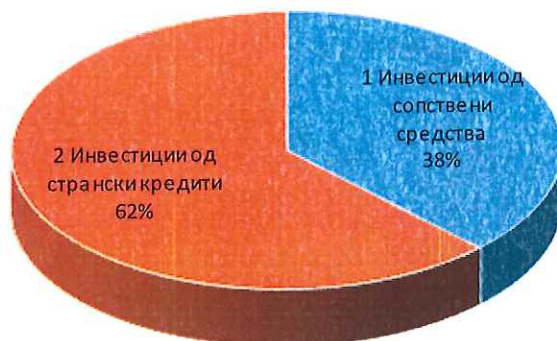
Инвестиции II квартал 2020