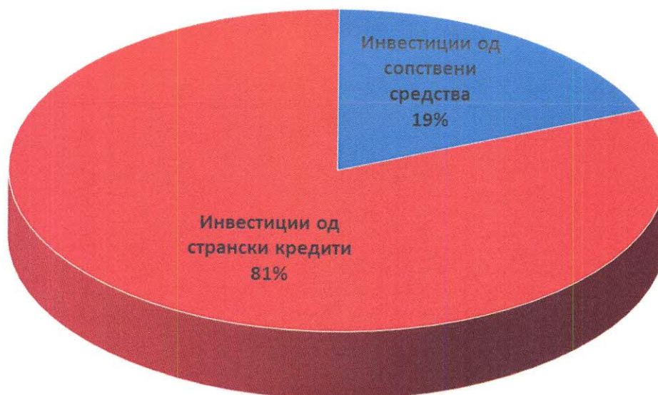
Вкупни инвестиции I квартал 2022 година