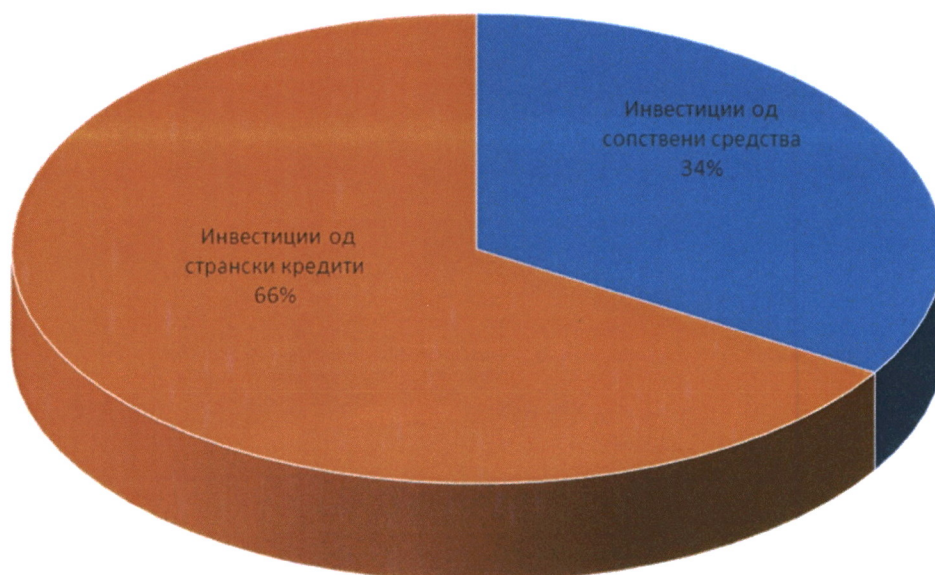
Инвестиции IV квартал 2020 година